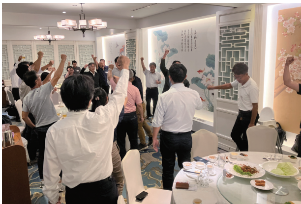
乾杯をする参加者の皆さま