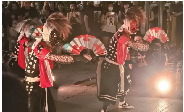
パフォーマンスの様子①