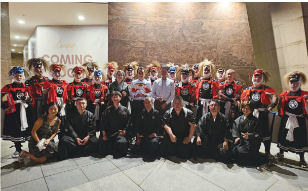
パフォーマーとの集合写真