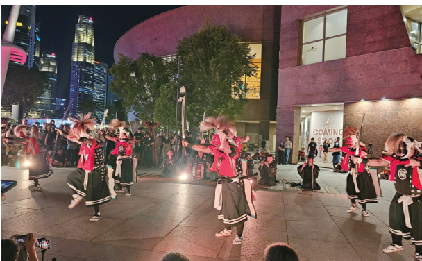
パフォーマンスの様子②