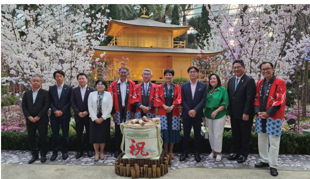
主催者とスポンサーの集合写真