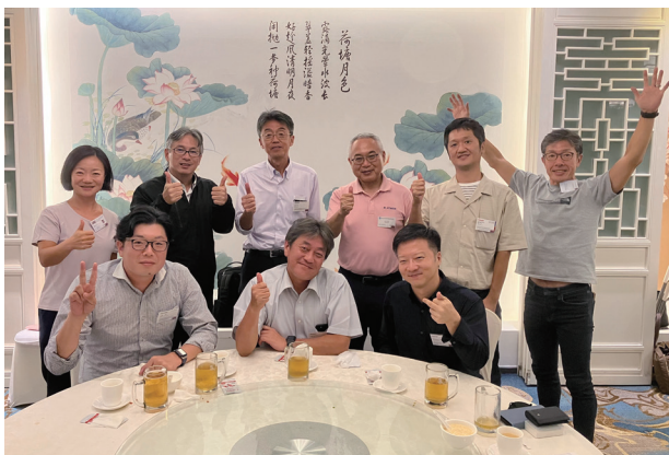
集合写真 (テーブル2)