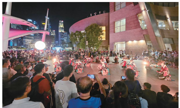
パフォーマンスを鑑賞する観客