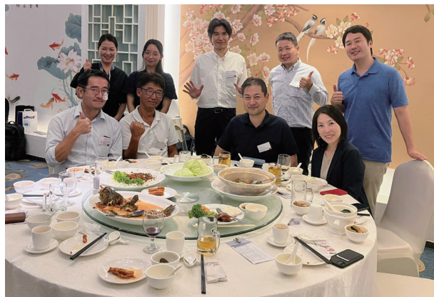
集合写真 (テーブル1)