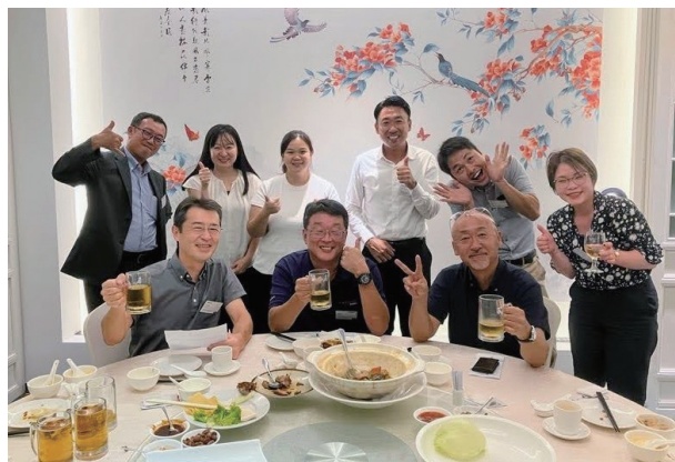
集合写真 (テーブル3)