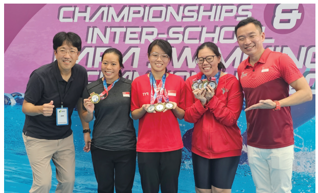
富井副会頭（富士通アジア）と選手達