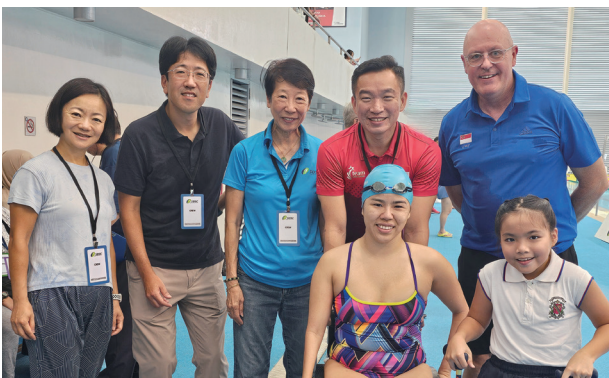
選手との集合写真